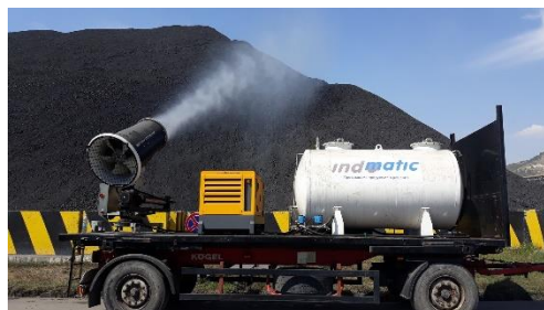
За открити площи