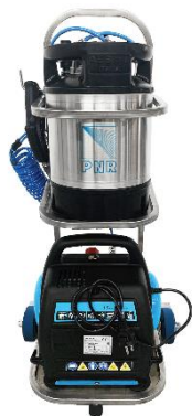
За обработка на повърхности