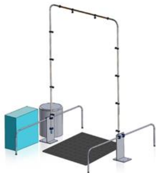
За хора и колички