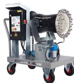
За големи помещения и производства